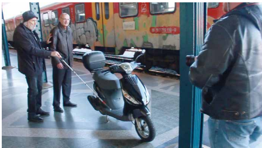
Primer 3: Luj želi na železniški postaji priti do perona. Na njegovi pešpoti je parkiran motor.