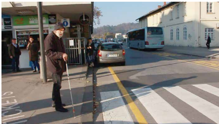
Primer 3: Luj prečka cesto, kjer ni zvočnega semaforja (glavna avtobusna postaja Ljubljana). Počaka na mimoidočo osebo in prosi za pomoč (čakal je skoraj 10 minut ob 11. uri dopoldne)