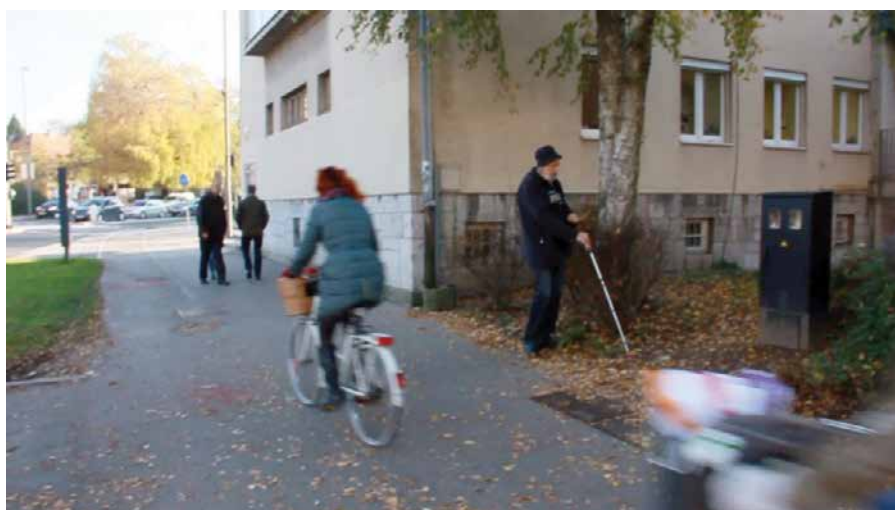
Primer 4: Luj prečka cesto, kjer sta kolesarska steza in pločnik drug poleg drugega. Slepi želi na avtobusno postajo, da pride do svojega doma.