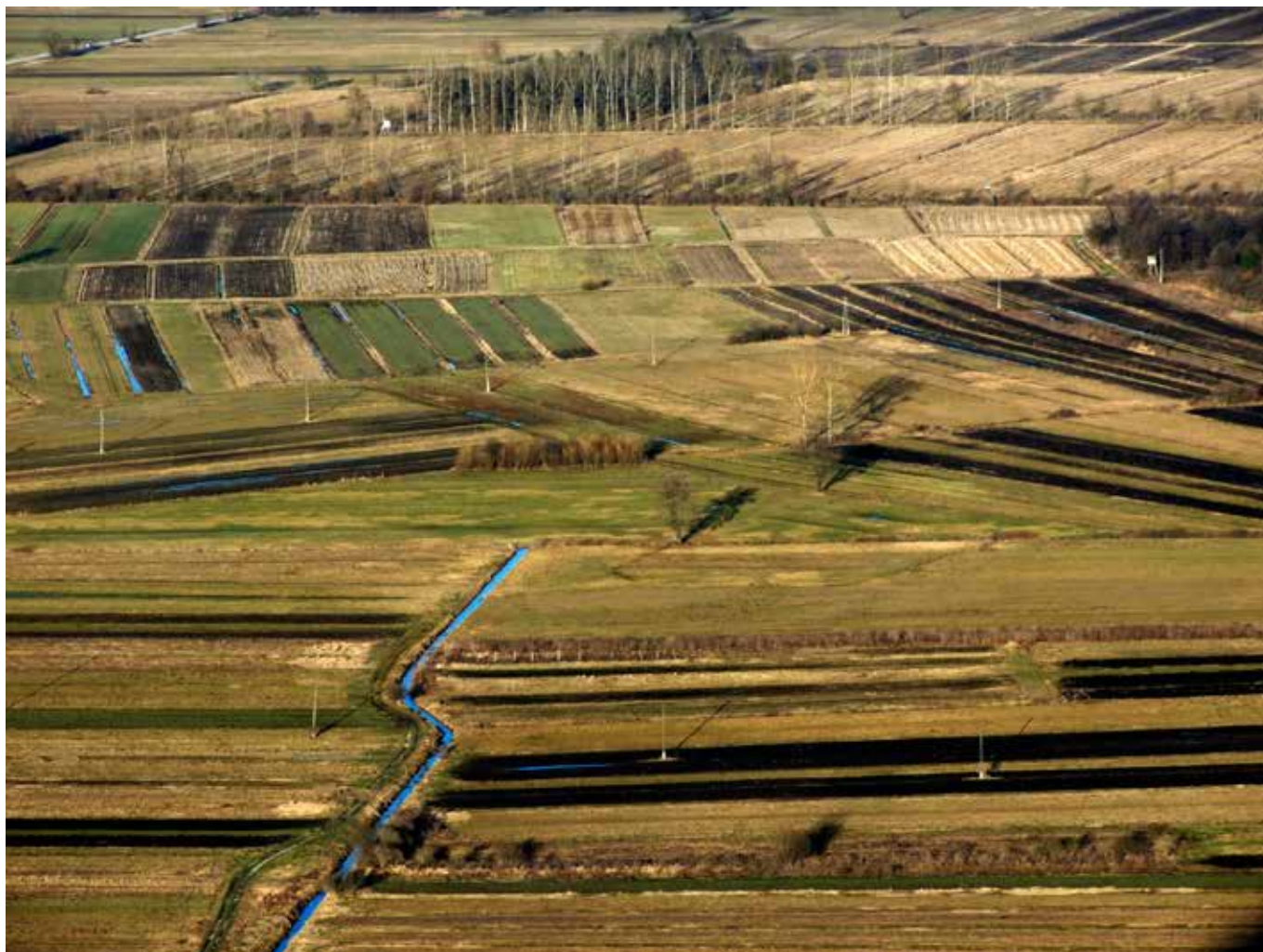
Ljubljansko barje iz zraka