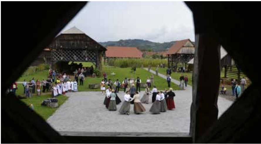
Folklorna skupina v Deželi kozolcev, ki se nahaja na območju LAS Dolenjska in Bela krajina.

Glede na vse navedeno je priprava kvalitetne strategije lokalnega razvoja zelo pomembna. Že pri analizah stanja območja, ki jih bo treba vključiti v nove strategije lokalnega razvoja, so podatki, s katerimi razpolagajo občine, zelo pomembni tudi za pripravo potreb in potencialov območja. Pri vzpostavitvi lokalnega partnerstva in pripravi strategije lokalnega razvoja je priporočljivo, da sodeluje čim več deležnikov, ki živijo in delajo na območju, kjer se bo le-ta izvajala. Vsak posameznik, društvo ali interesna skupina imajo lahko svoje poglede na nadaljnji razvoj, kar lahko pomembno prispeva k celoviti pripravi analize in dejanskim potrebam območja. Zato ste vse občine in lokalni prebivalci takoj po objavi javnega poziva vabljeni k aktivni vključitvi v lokalne akcijske skupine in k pripravi kvalitetnih novih strategij lokalnega razvoja, ki bodo odražale potrebe lokalnega območja.