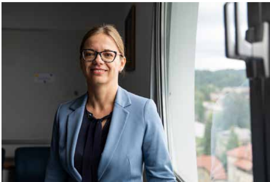
Ministrica Sanja Ajanović Hovnik

Eden pomembni rezultatov dela dveh prejšnjih delovnih skupin je Zakon o finančni razbremenitvi občin, ki je prinesel finančne razbremenitve občin in prenos nalog nazaj na državo. Menite, da so še rezerve in bi se dalo racionalizirati še kakšne postopke, naloge?